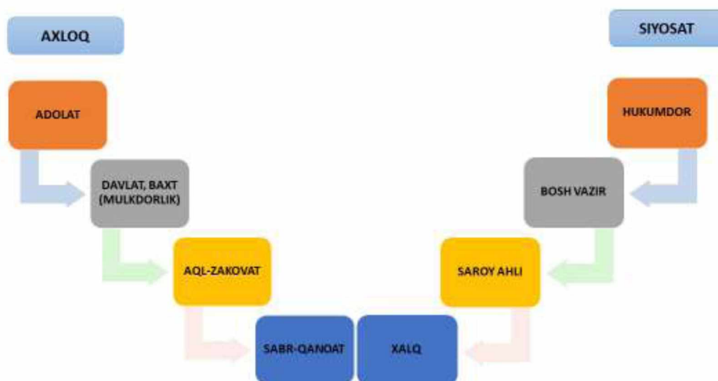
1-rasm. Yusuf Xos Hojibning boshqaruv sohasidagi qarshlarni tizimlashtiririlishi

Yusuf Xos Hojibning fikricha: "Kishi qanchalik yuqori martabaga erishmasin, u baribir kamtar bo'lib qolishi lozim"